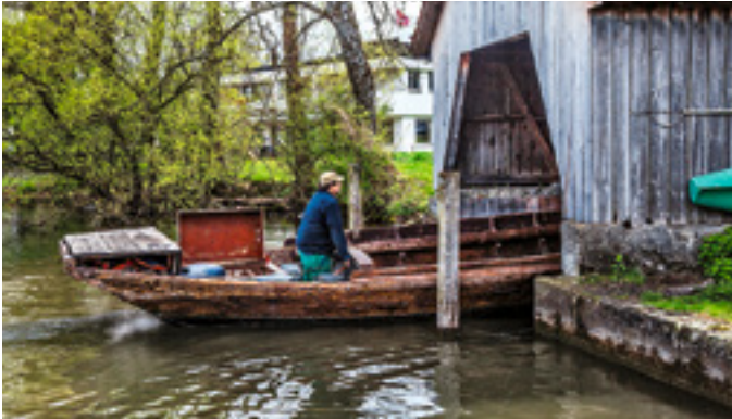
Gut versorgt: Die Tiere auf der Weide, der Kahn im Bootshaus.