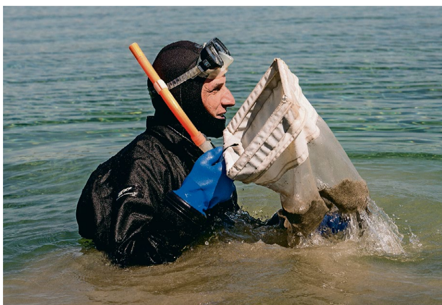
Die Bodenprobe zeigt: Die Asiatische Körbchenmuschel wurde eingeschleppt.

Video Der Muscheltaucher vom Zürichsee ufenua.tagesanzeiger.ch