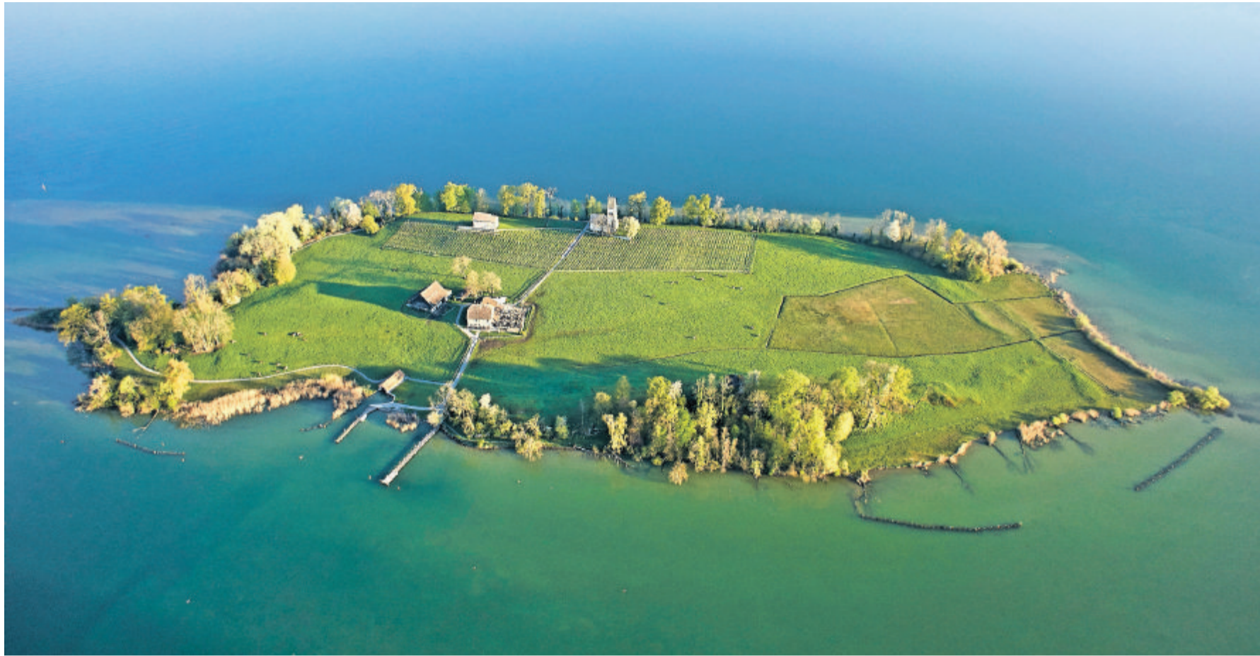
Mit einer Drohne aus 300 Meter Höhe aufgenommen: Die mit 17 Metern höchste Erhebung der Ufenau, der Arnstein, liegt rechts vom Schiffssteg.