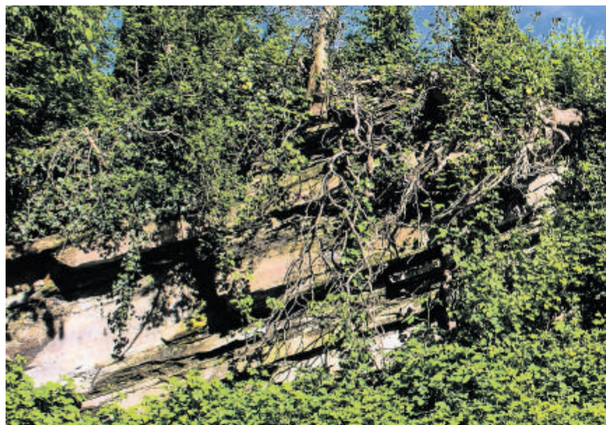
Teilweise steile Nagelfluhwände prägen die Nordseite der Insel.