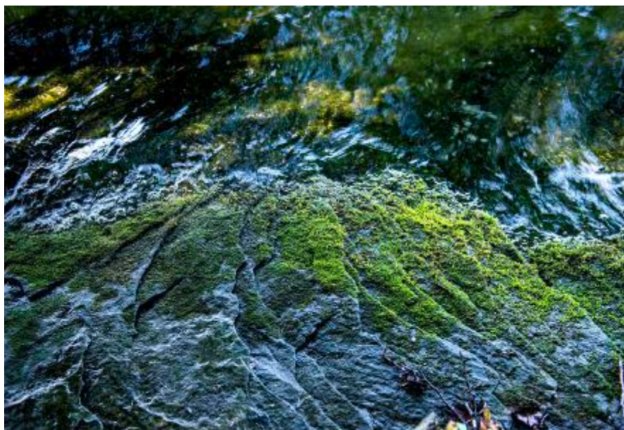
Am Nordufer verläuft ein Sandsteinrücken, der auch eine Flachwasserzone bildet.