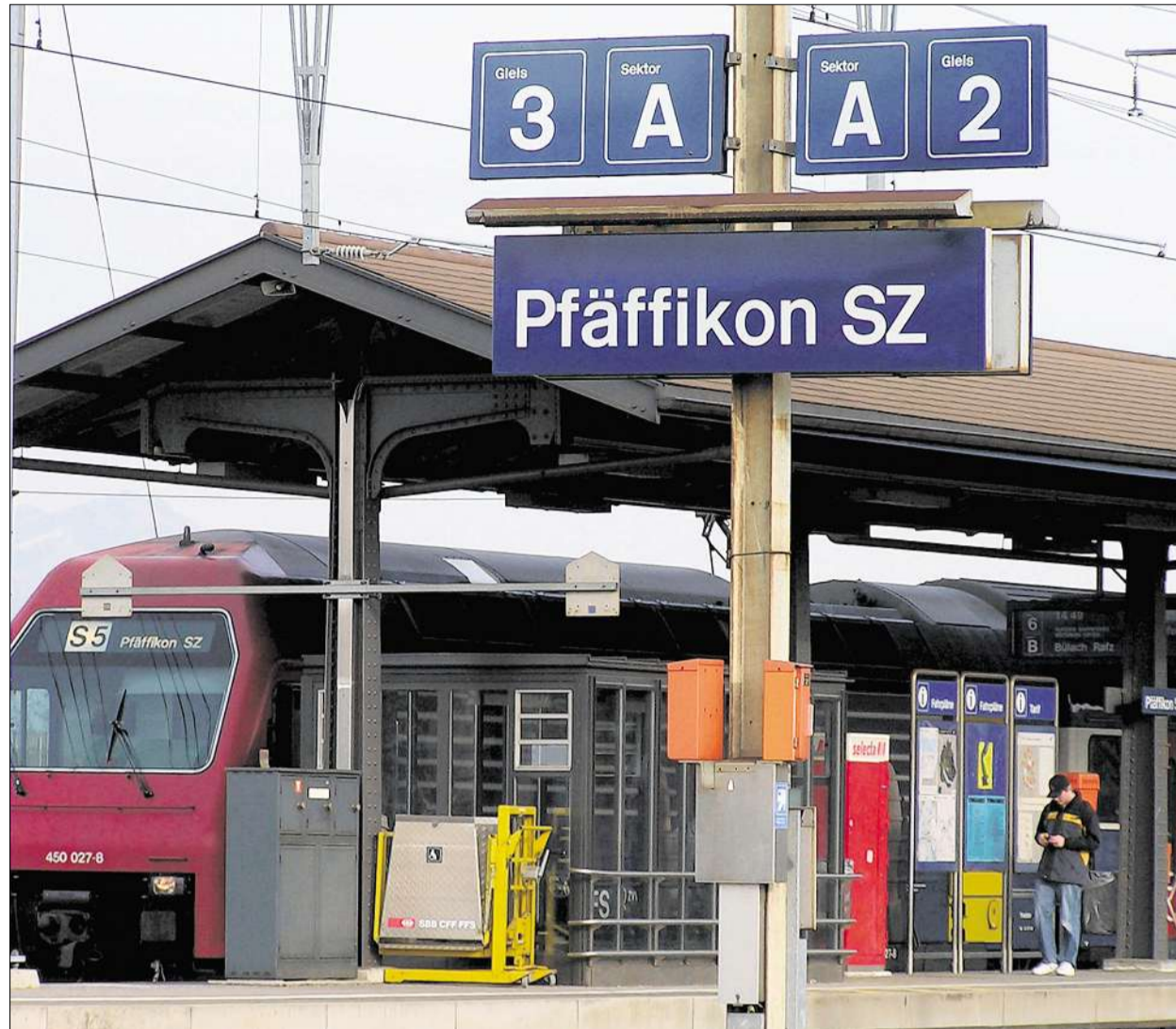
Für das Projekt Stadtbahn Obersee ist der Bahnhof Pfäffikon ein wichtiger Knotenpunkt. (spa)

Neben den normalen Kursschiffen der Zürichsee-Schiffahrtsgesellschaft fährt an diesen Tagen das Motorschiff «Obersee» vom Steg in Pfäffikon zur Ufenau (aus organisatorischen Gründen bittet der Verein Freunde der Insel Ufenau um Anmeldung auf fredy.kuemin@swissonline.ch oder Telefon 055 410 17 47). Samstag, 27. September: 12 und 14 Uhr. Rückfahrt ab 17.15 Uhr. Sonntag, 28. September: 11 und 14 Uhr. Rückfahrt 13.45 und 16.30 Uhr. (e)